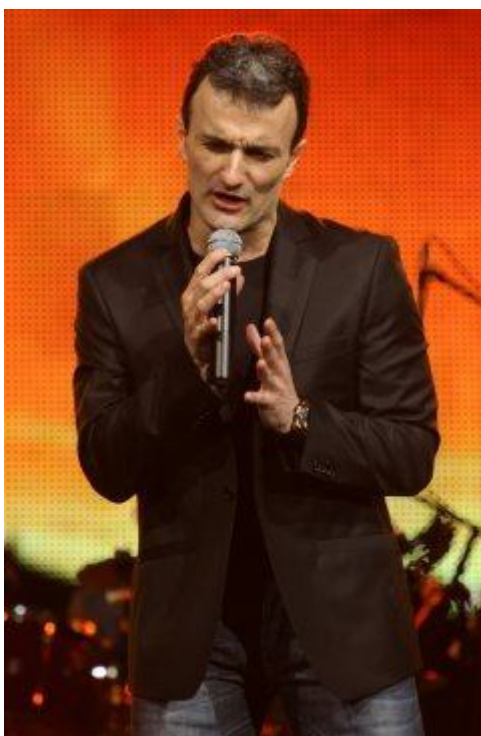
Čudi se što je omiljen među ženama