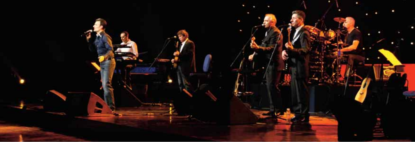
„Легенде“ на једном од концерата у Центру „Сава“

„Не рачунамо на оне који слушају музику која се своди на бум-бум-бум и једну реченицу, која је углавном прилично бесмислена и која се понавља унедоглед. Такви немају стрпљења да слушају песме „Легенди“. После треће строфе они кажу: дај, бре, ово је смор“