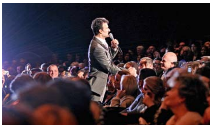
И следеће недеље пред публиком

– Пре 20 година овог мог клинца пазио сам да се не саплете о каблове и не полупа нешто, а сада на овој бини већ девети пут свира са нама. Није стално у поставци, али повремено помаже кад треба мало да се